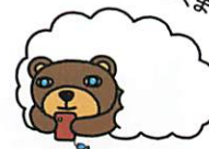
illustration by Yuhei Yamada

この他、当事者・家族の経験談の紹介、能登で利用できる福祉サービスや 関連民間団体の紹介があります。詳細はチラシウラ面をご覧ください。